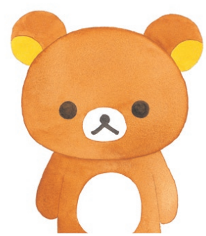
『リラックマ ここにいます』 (主婦と生活社 2015年)