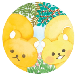
『リーとスーのどこ?どこ?どこ?』 (教育画劇 2019年)

1997年、文具会社デザイン室入社。「みかんぼうや」「リラックマ」などのキャラクター原案、商品デザインなどを担当。2003年退社後は、フリーでキャラクターデザインや絵本制作などを行う。主な作品に「うさぎのモフィ」「ニャーおっさん」「おふとんさん」など。