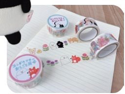
マスキングテープ ¥495(税込)