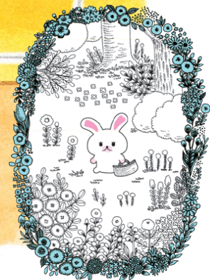
『うさぎのモフィ もりのまいにち』 (主婦と生活社 2021年)

『リラックマ』の原作者、コンドウアキの最新絵本『ゆめぎんこう』は、ペンギンのぺんぺんが営む「夢」を扱うお店が舞台。そこで売られているのは、アメになった夢の数々です。アメを買いに来るお客さま、夢を売りに来るお客さまとのふれあいの中でぺんぺんが体験する夢の世界が、繊細な色彩と柔らかな優しい言葉で表現されています。絵本制作のほかに、キャラクターデザイナーとしても活躍する彼女は「リラックマ」をはじめ、「うさぎのモフィ」(世界の30以上の国や地域でアニメーションが放映されている)、「ウーとワー」「おふとんさん」など、親しみやすい、世代を超えてたくさんの人に愛されているキャラクターを生み出しています。コンドウアキの作家生活20周年を記念する本展覧会では、デビュー作『木からおりたミカン』(みかんぼうや)から、最新作となる『ゆめぎんこう』まで、コンドウアキ作品を幅広く、網羅的にご紹介します。どこか安心するような親しみのあるキャラクターとともに、日常のなにげない、愛しい時間を届ける作品の数々をどうぞお楽しみください。